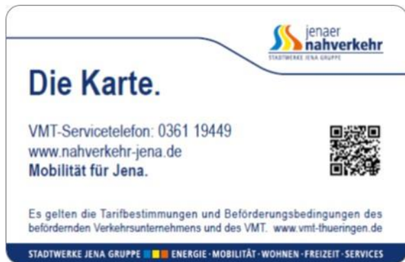
Abbildung 8 - Rückseite VMT-Chipkarte JNV

Die Layout-Datei (Druckdaten) für den Chipkartenhintergrund für die Vorder- und Rückseite wird den Verkehrsunternehmen von der VMT GmbH zur Verfügung gestellt. Die unternehmensspezifische Rückseite ist gemeinsam mit der VMT GmbH abzustimmen.