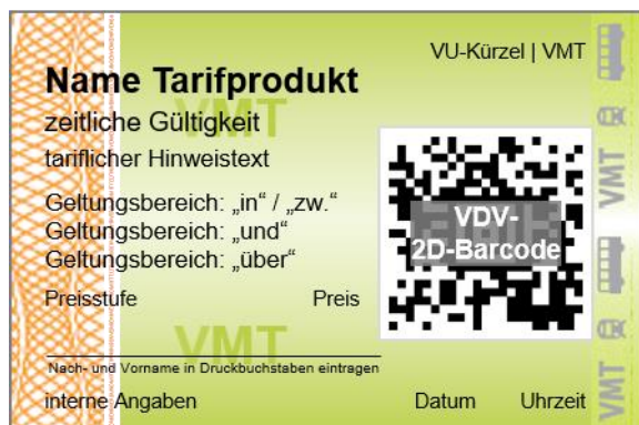
Abbildung 2 - Fahrausweislayout - entwertete Ausgabe

Abbildung 2 zeigt die Anordnung der Angaben auf einem entwerteten Fahrausweis (ohne Abo-Produkte). Das Feld zum Eintragen des Namens ist nur bei persönlichen Zeitkarten aufzudrucken (siehe hierzu unter Abschnitt 1.6.2).