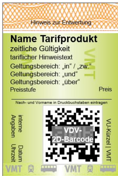
Abbildung 1 - Fahrausweislayout - unentwertete Ausgabe

Die nachfolgende Abbildung zeigt die Anordnung der Angaben auf einem unentwerteten Fahrausweis.