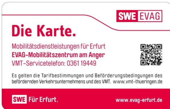
Abbildung 7 - Rückseite VMT-Chipkarte EVAG

Die Rückseite der Chipkarte zeigt das Abo ausgebende Verkehrsunternehmen. Die nachstehenden Abbildungen zeigen beispielhaft die Chipkarten-Rückseiten für EVAG und JNV.