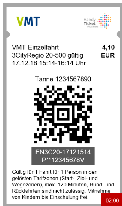
Abbildung 5 - Layout VMT-Handy-Ticket (Beispiel)