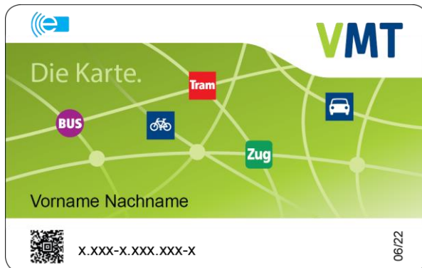
Abbildung 6 - Vorderseite VMT-Chipkarte

Die Rückseite der Chipkarte zeigt das Abo ausgebende Verkehrsunternehmen. Die nachstehenden Abbildungen zeigen beispielhaft die Chipkarten-Rückseiten für EVAG und JNV.