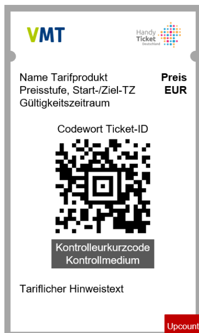
Abbildung 4 - Layout VMT-Handy-Ticket

Die folgenden beiden Abbildungen zeigen die Anordnung der Angaben/Elemente für das VMT-Handy-Ticket, das über die API-Schnittstelle der Firma HanseCom ausgegeben wird.