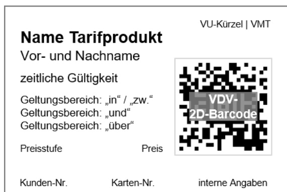
Abbildung 3 - Fahrausweislayout - Abo-Produkte

Abbildung 3 zeigt die Anordnung der Angaben für Abo-Produkte . Der Kunden-Name ist nur bei persönlichen Abo-Produkten aufzudrucken.