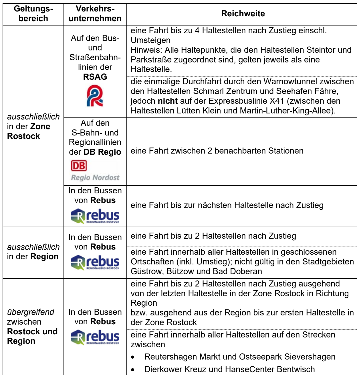
Tabelle 2: Gültigkeitsbereich der Einzelfahrkarten für eine Kurzstrecke

Hinweis: In Verkehrsmitteln der Verkehrsunternehmen, die nicht in der