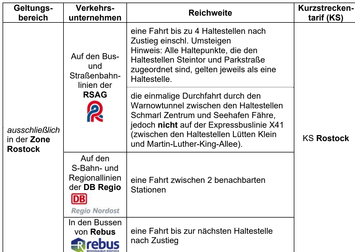
Tabelle 1: Gültigkeitsbereich der Einzelfahrkarten für eine Kurzstrecke

Der Gültigkeitsbereich der Einzelfahrkarten für eine Kurzstrecke ist in Tabelle 1 nach den Merkmalen Geltungsbereich , Verkehrsunternehmen , Reichweite und Kurzstreckentarif beschrieben.